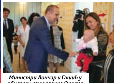
Министри Лончар и Гашић у обиласку крушевачке Опште болнице