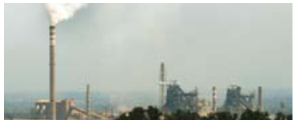
Покретање производње у МСК, паљење друге пећи у Смедереву и поспешивање производње у Азотари додатно ће подстаћи српску привреду