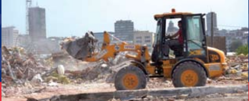
Радови у Савском амфитеатру