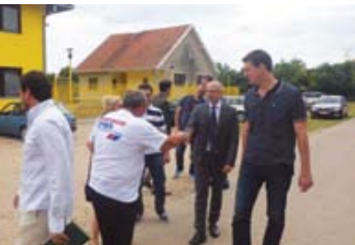
Ада - Мол