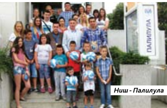
Ниш - Палилула

Захваљујући хуманитарној акцији „Помозимо нашој деци“, коју две године реализује Градска