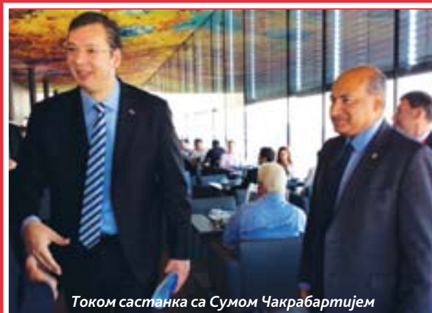
Током састанка са Сумом Чакрабартијем

Премијер Вучић разговарао је и са председником ЕБРД, Сумом Чакрабартијем, о изградњи аутопута Ниш - Приштина - Драч, и изразио очекивање да Србија већ пре краја 2016. године може да почне са извођењем грађевинских радова на деоници пута Ниш - Мерошина - Прокупље - Куршумлија - Мердаре, у дужини од 77 километара. Председник Чакрабарти нагласио је да ће ЕБРД учинити све како би убрзала реализацију овог изузетно значајног пројекта за цео регион, и истакао да он лично често Србију наводи као пример успешних фискалних реформи. Чакрабарти је позвао премијера Вучића да присуствује великом Инвестиционом самиту у Лондону, у фебруару следеће године. Премијер Вучић је од ЕБРД-а затражио савете и помоћ у привлачењу страних инвестиција, подршку пројектима Светске банке у приватизацији предузећа, нарочито оних у реструктурирању, као и њихово искуство у развијању предузетничког духа, чији недостатак је највећа сметња брзом економском напретку Србије.