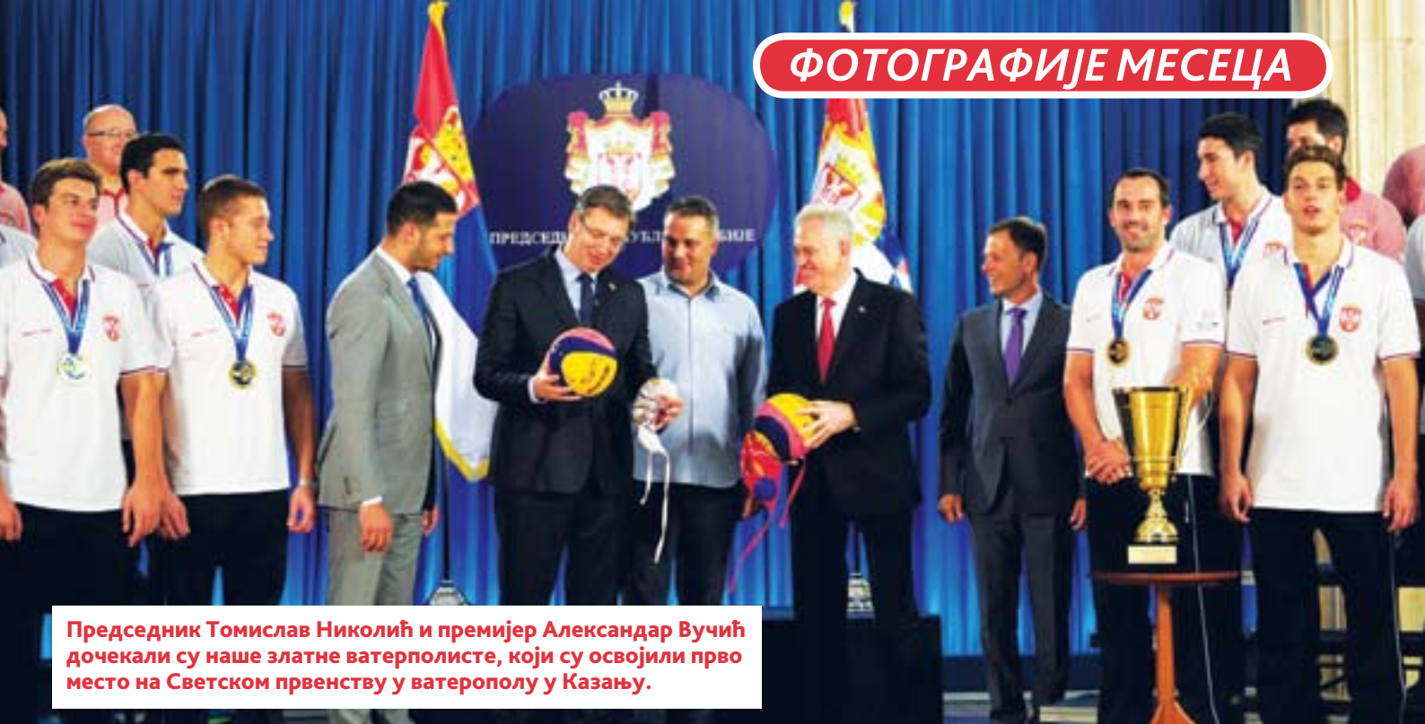
Председник Томислав Николић и премијер Александар Вучић дочекали су наше златне ватерполисте, који су освојили прво место на Светском првенству у ватерополу у Казању.