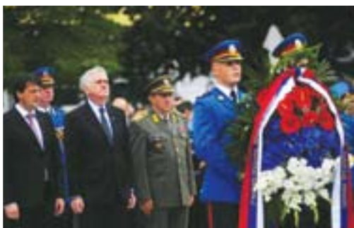
Постављање венаца на Споменик косовским јунацима у Крушевцу