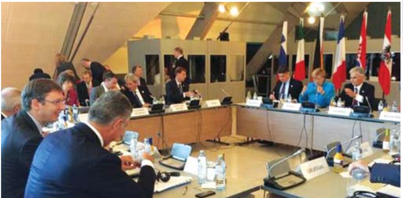
Српски премијер на Самиту лидера Западног Балкана

чићем, постала фактор стабилности у региону и изразио наду да ће почетком 2016. бити отворена прва поглавља.