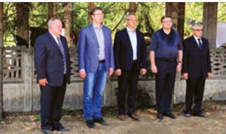
Премијер Вучић одаје пошту страдалим тачно у подне, 5. августа, када су се огласиле сирене и црквена звона у Србији и Републици Српској

Централној државној манифестацији у Сремској Рачи присуствовали су чланови влада Србије и РС, председница Народне скупштине Србије, Маја Гојковић, представници Народне скупштине РС и других државних органа, представници Војске Србије, Српске православне цркве, дипломатског кора... Наредног дана, 5. августа, проглашен је Дан жалости, а тачно у подне огласиле су се сирене и звона са српских православних цркава у Србији и Републици Српској, парастос је служен испред цркве Светог Марка у Београду, а одржана је и Меморијална академија у Центру „Сава“.