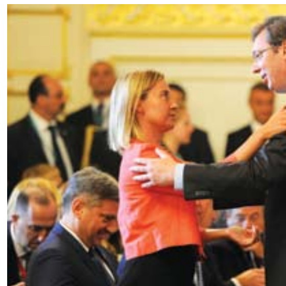
Срдчан сусрет: Европска комесарка Федерика Могерини и премијер Александар Вучић

Самит у Бечу дао је и прве резултате - аустријски вицеканцелар и министар привреде, Рајнхолд Митерлене, најавио да ће ЕУ државе Западног Балкана подржати са 600 милиона евра за енергетске, саобраћајне и железничке пројекте. Потврђена су 24 пројекта, који ће бити реализовани наредних година, у вредности од око 7,7 милијарди евра, чиме би требало да буде постигнут раст БДП-а од један одсто годишње у земљама Западног Балкана, с циљем да се у наредних 15 година отвори 200.000 нових радних места.